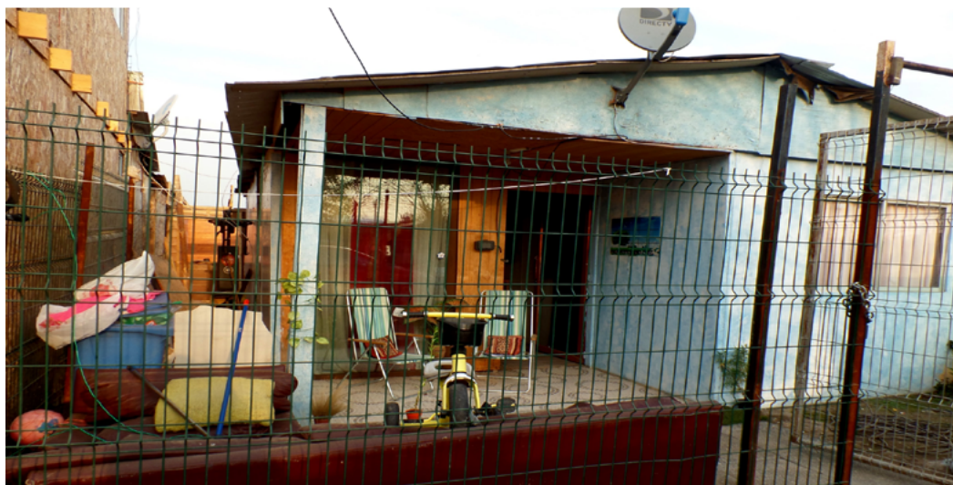
Imágenes 1, 2, y 3: Viviendas de un campamento en la comuna de Colina, Región Metropolitana.